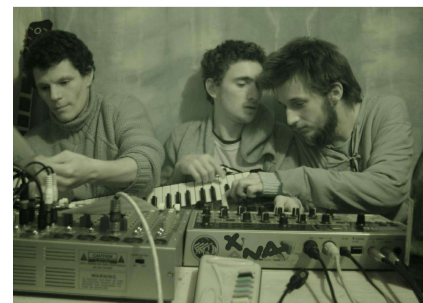
Литературен вестник 7-13.4.2004